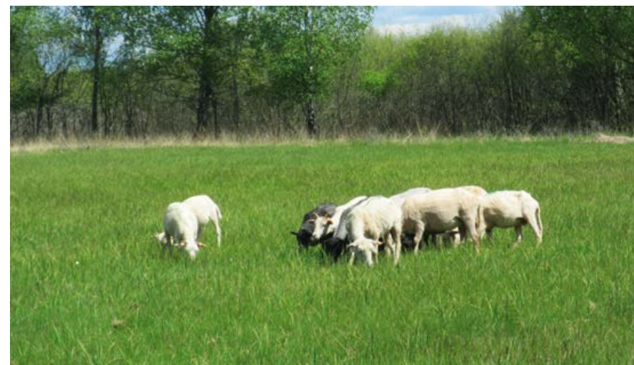
Wypas owiec.

wodę. Na torfowiskach prowadzi się również zabiegi koszenia czy wypasu zwierząt, co zapobiega zarastaniu tego siedliska przez drzewa i krzewy.