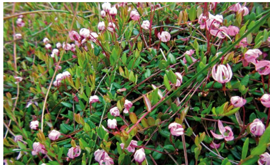
Żurawina błotna.

Oprócz wyjątkowych rosziczek, na torfowiskach wysokich i przejściowych spotkamy rośliny o jadalnych owocach, w tym żurawinę błotną i borówkę bagienną (przez Kaszubów zwana łochynią). Owoce borówki bagiennej możemy zbierać w środku lata. W tym samym czasie na łodygach żurawiny znajdziemy dopiero różowe kwiaty, tak więc na jej zbiór warto wybrać się nieco później, we wrześniu i październiku.