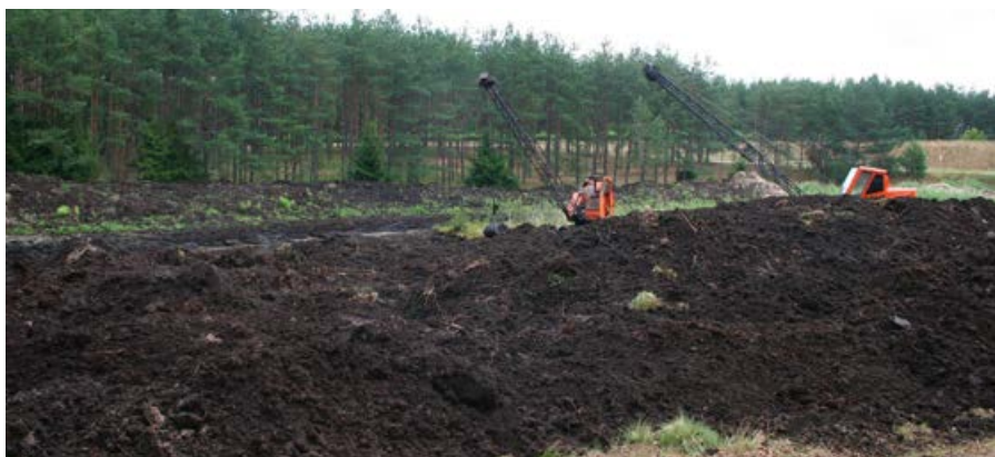
Dewastacja torfowiska.

Torfowiskom zagraża nie tylko to, co dzieje się bezpośrednio na jego powierzchni, ale również to, co dzieje się w jego otoczeniu, jak np. wycinka lasu rosnącego w bezpośrednim sąsiedztwie czy zbyt obfite nawożenie pobliskich pól. Użyźnianie torfowiska, odwadnianie czy zmiany kwasowości powodują zamieranie wrażliwej roślinności, a w efekcie degradację siedliska.