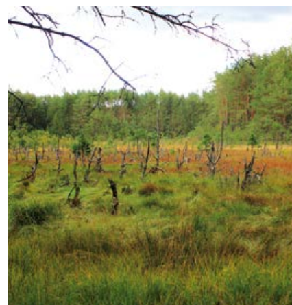
Użytek ekologiczny Tucholskie Mszary.