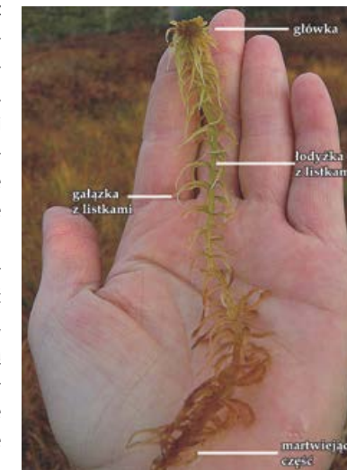
Budowa mchu torfowca.

Drugą ważną grupą roślin torfowiskowych są turzycy. Są one podobne do traw, jednak gdy przyjrzeć im się bliżej, dostrzec można różnice. Na przykład, łodygi turzyc w odróżnieniu od traw w przekroju są trójkątne i na próżno szukać na nich charakterystycznych dla traw zgrubień pędów, czyli kolanek. Turzycę najliczniej spotkamy na torfowiskach niskich, gdzie stanowią główną grupę roślin.