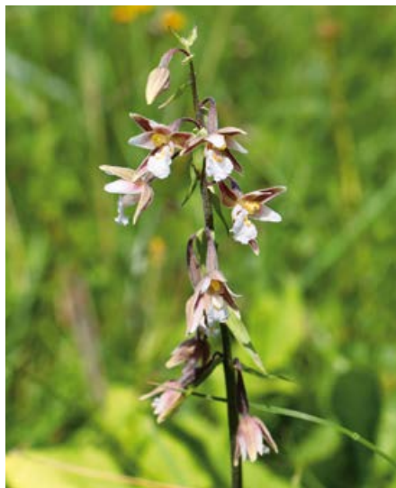
Kruszczyk błotny.