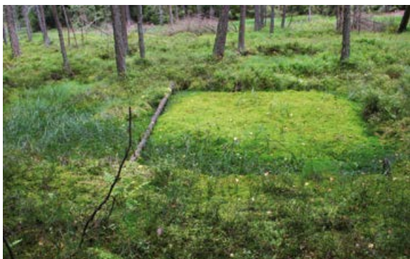
Torfkule – dawne miejsca wydobycia torfu.

Niestety wiele torfowisk bezpowrotnie utracono również na skutek przemysłowego i nielegalnego wydobycia torfu, głównie na cele ogrodnicze. Dlatego też przed zakupem ziemi ogrodowej warto się zastanowić i wziąć pod uwagę, iż kupując torf, być może nieświadomie przyczyniamy się do niszczenia tych cennych ekosystemów.