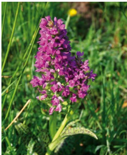
Kukułka szerokolistna.

Na torfowiskach niskich i wilgotnych łąkach, powstałych z przekształconych torfowisk, możemy spotkać storczyki. Być może nie są one tak okazałe i barwne, jak te trzymane na domowych parapetach, ale różowe kwiatostany kukułki szerokolistnej czy dwubarwne kwiaty kruszczyka błotnego niejednego przyrodnika wprawiły w zachwyt. Rozmnażanie storczyków jest niezwykle ciekawe, a samo zapylenie to zaledwie początek procesu. Co ciekawe, małym i niezdolnym do samodzielnego kiełkowania nasionom niezbędny do dalszego rozwoju jest odpowiedni gatunek grzyba.