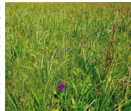
Torfowisko niskie.

Torfowiska niskie – zasilane są przez zasobne w substancje odżywcze płynące lub stojące wody powierzchniowe lub gruntowe. Wody zasilające te torfowiska cechuje duża zawartość substancji mineralnych, co znajduje odzwierciedlenie w charakterze roślinności torfotwórczej i bogactwie gatunków, przeważają tu mchy brunatne, turzyce i wiele roślin kwiatowych, jak np. storczyki. Torfowiska niskie występują głównie w dolinach rzek, nad jeziorami czy przy źródłiskach.