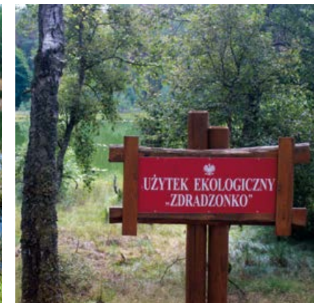
Tablica informacyjna. Użytek Ekologiczny.

Torfowiska można chronić na wiele sposobów, tam, gdzie jest to niezbędne, stosuje się zabiegi czynnej ochrony, tj. ręczne usuwanie siewek drzew i krzewów, wykaszanie i wypas, lub obejmuje się je bierną ochroną, tworząc rezerваты przyrody lub użytki ekologiczne.