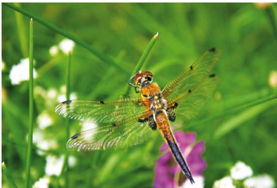
Ważka czteroplama.

Najliczniej, jak we wszystkich ekosystemach, występują bezkręgowce. Również wśród tych drobnych zwierząt jest wiele chronionych gatunków. Między drzewami i krzewinkami plotą swą sieć pająki. Nad wodą w oczy rzucają się kolorowe ważki. Są drapieżnymi owadami, które polują w dziennym świetle i łapią swoje ofiary w locie. Eskadry brzęczących żagnic, gadziogłówek i husarzy przecinają powietrze we wszystkich kierunkach. Dużo delikatniejsze świtezianki i łątki unoszą się cicho i delikatnie osiadają na roślinach.