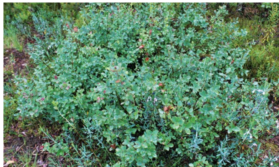
Borówka bagienna.