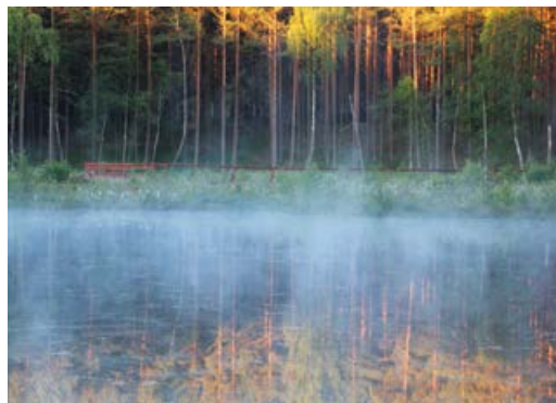
Torfowisko Żabińskich Błota.

Nie bez znaczenia są również walory estetyczne tych ekosystemów. Przemierzając tereny Wdzydzkiego Parku Krajobrazowego, niejednokrotnie możemy dostrzec małe szafirowe śródleśne jeziora otulone kołdrą torfowców. Są one wyjątkowym elementem kaszubskiego krajobrazu.