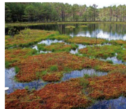
Torfowisko przejściowe.

Torfowiska przejściowe łączą w sobie elementy obu poprzednich. Powstają w miejscach, w których gromadzi się duża ilość wód opadowych i do których spływa niewielka ilość żyznych wód podziemnych. Możemy tu spotkać zarówno rośliny charakterystyczne dla torfowisk wysokich (mchy torfowce), jak i niskich (turzyce).