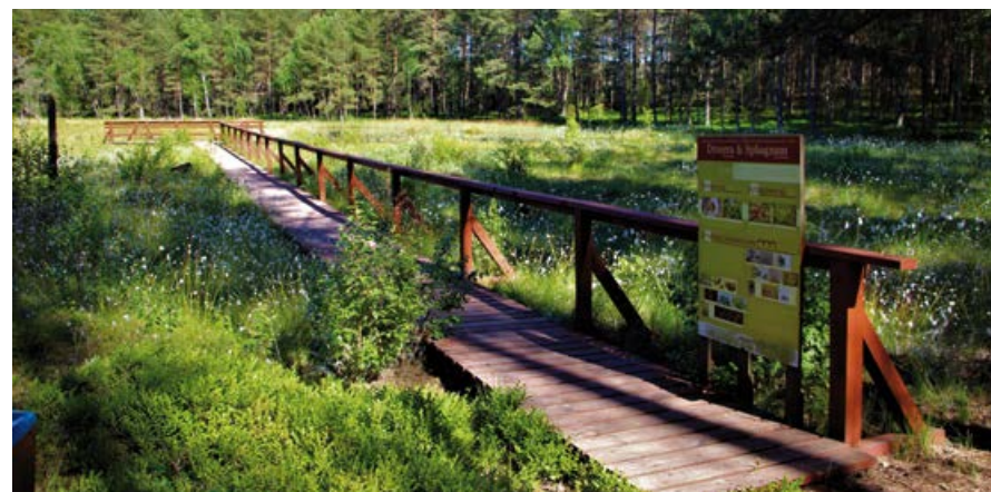
Użytek ekologiczny Żabińskich Błoto z kładką edukacyjną.