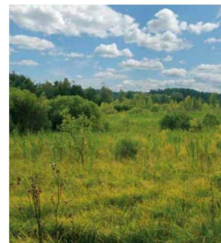
Planowany użytek ekologiczny Skalnica nad Wyrównem.