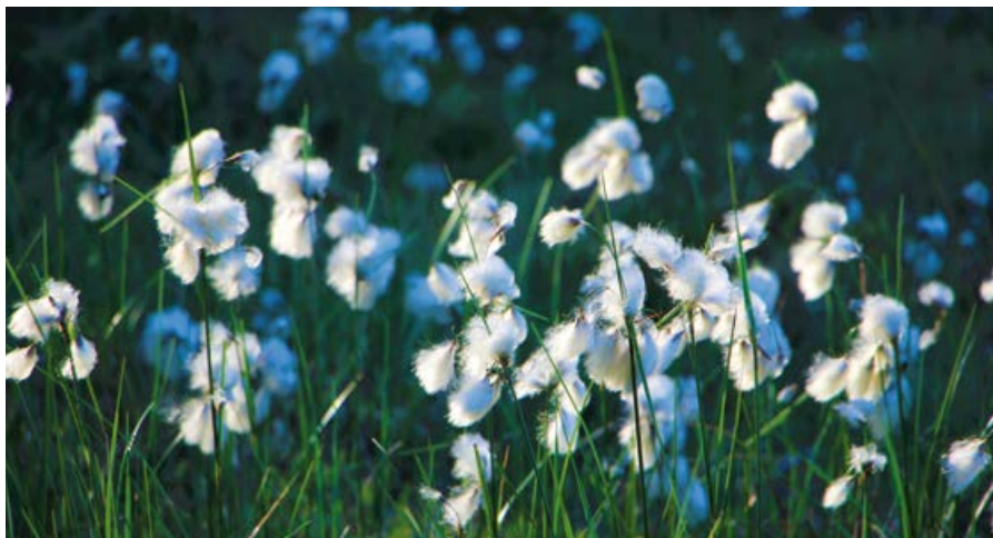
Wełnianka wąskolistna.

Łudząco podobne do turzyc są wełnianki, które spotkamy zarówno na torfowiskach niskich, wysokich, jak i przejściowych. Po przekwitnięciu ich widoczne z daleka kwiatostany przypominają pęczki białego puchu.