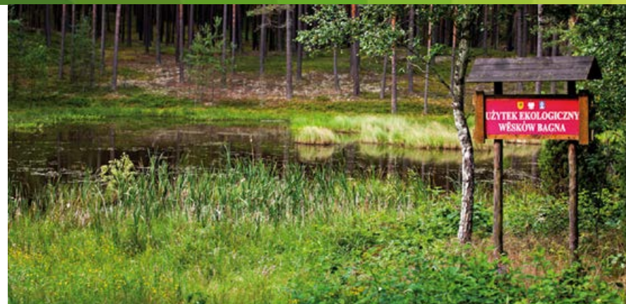
Użytek ekologiczny Wesków Bagno.