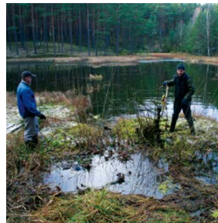
Ręczne odkrzaczanie torfowiska.

Torfowiskom zagraża nie tylko to, co dzieje się bezpośrednio na jego powierzchni, ale również to, co dzieje się w jego otoczeniu, jak np. wycinka lasu rosnącego w bezpośrednim sąsiedztwie czy zbyt obfite nawożenie pobliskich pól. Użyźnianie torfowiska, odwadnianie czy zmiany kwasowości powodują zamieranie wrażliwej roślinności, a w efekcie degradację siedliska.