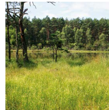
Użytek ekologiczny Zdradzonko.