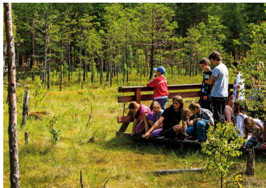
Zajęcia edukacyjne na torfowisku.

W zachowaniu torfowisk niezmiernie ważna jest edukacja ekologiczna i informowanie społeczeństwa o znaczeniu mokradeł dla przyrody, klimatu i ludzi.