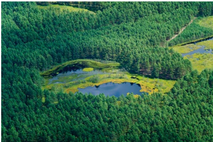
Planowany rezerwat przyrody Motowężę.

Motowężę. Obszar torfowiskowo-krajobrazowy rozciągający się na powierzchni około 118 ha. Obejmuje fragment równiny sandrowej z zespołem bezodpływowych, wytopiskowych, oligo- i dystroficznych jezior (Czarne, Syconki Małe, Syconki Wielkie, Motowężę) oraz torfowisk pośród dużego kompleksu borów sosnowych na zachód od jeziora Wdzydze.