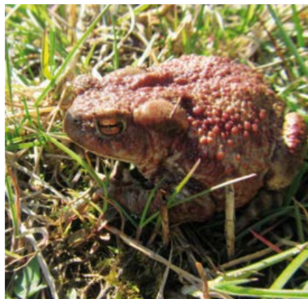
Ropucha szara.

Najliczniej, jak we wszystkich ekosystemach, występują bezkręgowce. Również wśród tych drobnych zwierząt jest wiele chronionych gatunków. Między drzewami i krzewinkami plotą swą sieć pająki. Nad wodą w oczy rzucają się kolorowe ważki. Są drapieżnymi owadami, które polują w dziennym świetle i łapią swoje ofiary w locie. Eskadry brzęczących żagnic, gadziogłówek i husarzy przecinają powietrze we wszystkich kierunkach. Dużo delikatniejsze świtezianki i łątki unoszą się cicho i delikatnie osiadają na roślinach.