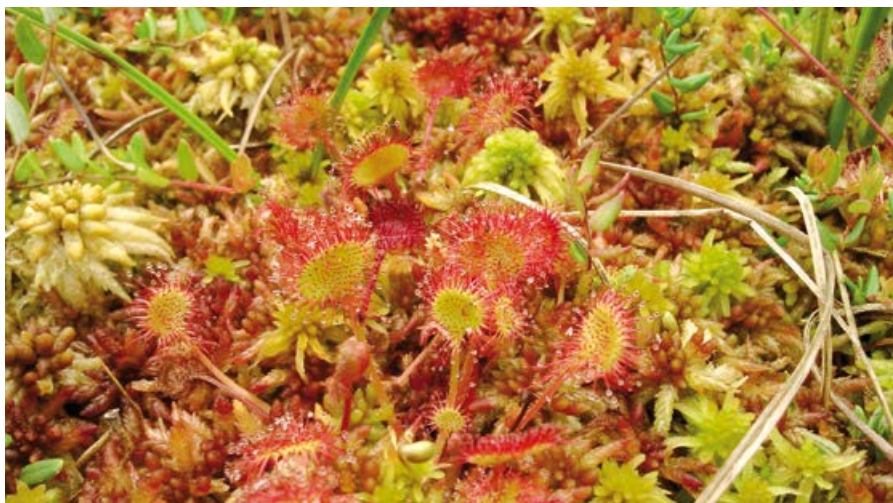
Rosiczka okrągłolistna.

Wyjątkową grupę roślin stanowią rosziczki, które rekompensując sobie niedobory azotu w podłożu, przystosowały się do łapania i trawienia owadów. Kropelki gęstej cieczy, gromadzące się na włoskach porastających ich liście, działają jak lep na muchy. Złapany raz owad jest mocno przyklejony i nie ma szans na ucieczkę. Liść ze zdobyczą powoli się zwija i zamyka, a roślina rozpoczyna trawienie. Pomimo swej drapieżności, roślina jest wyjątkowo delikatna i niewielka, sięgając kilku centymetrów. Warto się nad nią pochylić i przyjrzeć bliżej jej niezwykłej budowie.