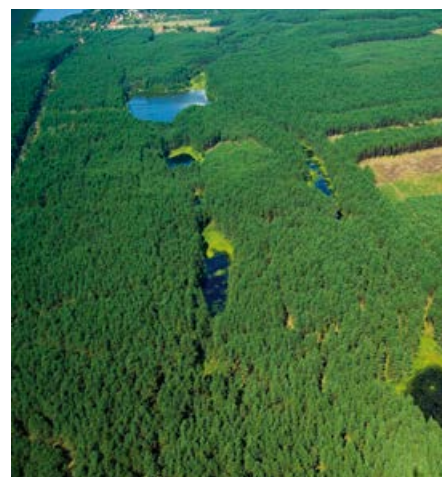
Planowany użytek ekologiczny Torfowiska Wałachy.

Torfowiska Wałachy. Obejmuje trzy niewielkie torfowiska przejściowe w rynnach na wschód od jeziora Wałachy. Poza stanowiskami cennych zbiorowisk roślinnych i gatunków flory torfowiskowej obiekt stanowi również ważne miejsce dla ochrony rzadkich gatunków ważek.