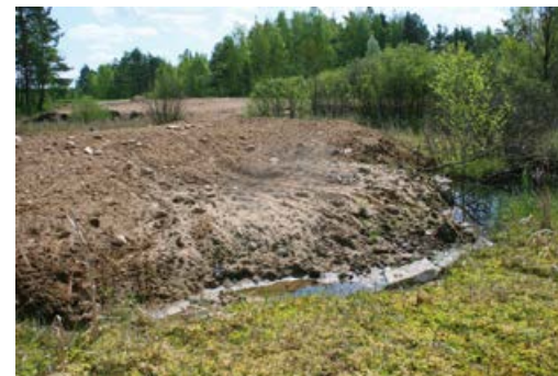
Częściowo zasypane torfowisko – dewastacja siedliska.

Niestety torfowiska to jedno z najszybciej znikających ekosystemów. Przez długi czas przeważało myślenie, że nie mają większego znaczenia dla człowieka. Meliorowano podmokłe łąki, osuszano torfowiska, zmieniając ich sposób użytkowania na rolniczy, zasypywano lub zmieniano w stawy rybne małe zbiorniki wodne.