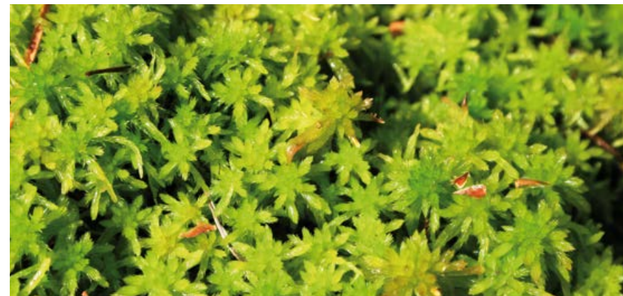
Mech torfowiec.

Na torfowiskach panują szczególne warunki. Dla wielu roślin jest tam za mokro i zbyt ubogo. W związku z tym, że są to warunki specyficzne, tylko część gatunków zdołała się do nich przystosować. Są to rośliny, którym nie przeszkadza duża wilgotność, mała żyzność, ale większość z nich nie przetrwałaby w innych warunkach. Wiele roślin występujących na torfowiskach to gatunki prawnie chronione.