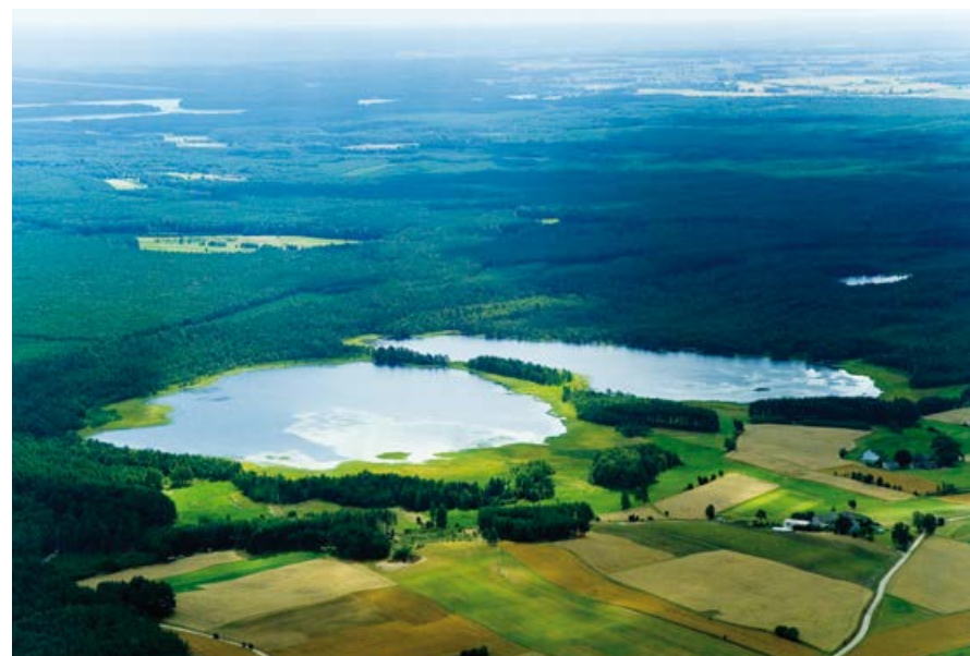
Planowany rezerwat przyrody Lipno.

Skalnica nad Wyrównem. Obejmuje zatorfioną byłą zatokę jeziora Wyrównno wraz z położonym na jej północnym skrzydle torfowiskiem niskim (źródłiskowym), na którym podawane jest stanowisko skalnicy torfowiskowej. Gatunek znany zaledwie z kilku stanowisk w Polsce.