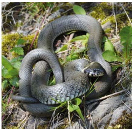
Zaskroniec zwyczajny.