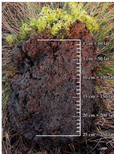
Skala przyrostu torfu.

co roku kolejne warstwy masy roślinnej nie rozkładają się, tworząc pokłady torfu. Odkładanie się kolejnych warstw torfu powoduje, że torfowisko cały czas „rośnie” i ciągle się zmienia. Proces powstawania torfowisk jest bardzo powolny i w zależności od jego rodzaju warstwa torfu przyrasta od 0,4 mm (torfowisko niskie) do 1 mm (torfowisko wysokie) rocznie. Miąższość torfu naszych torfowisk często sięga nawet kilku metrów.