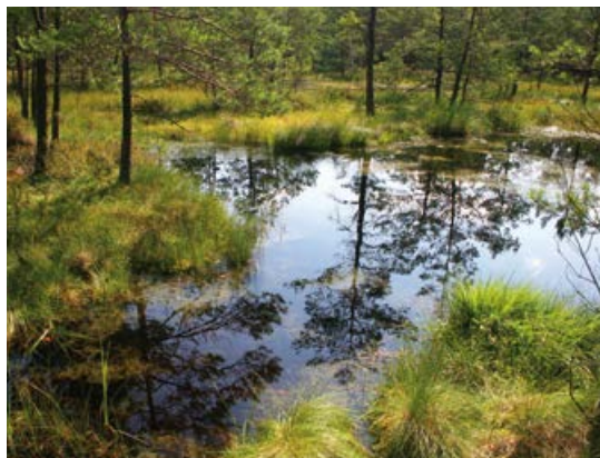
Woda na torfowisku.

Torfowiska chronią więc przed powodzią, ale i przed suszą, gdyż zgromadzona w okresie letnim bardzo wolno zostaje oddana do środowiska. Trzeba również podkreślić, iż woda przefiltrowana przez warstwę roślin oczyszcza się, więc torfowiska działają nie tylko jak wielkie magazyny wody, ale także jak biologiczne oczyszczalnie. Odgrywają zatem bardzo ważną rolę w kształtowaniu stosunków wodnych i klimatycznych.