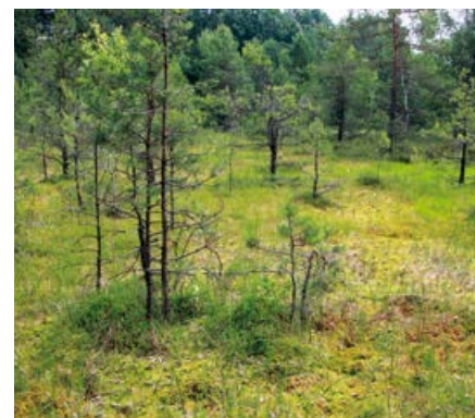
Torfowisko wysokie.

Torfowiska przejściowe łączą w sobie elementy obu poprzednich. Powstają w miejscach, w których gromadzi się duża ilość wód opadowych i do których spływa niewielka ilość żyznych wód podziemnych. Możemy tu spotkać zarówno rośliny charakterystyczne dla torfowisk wysokich (mchy torfowce), jak i niskich (turzyce).