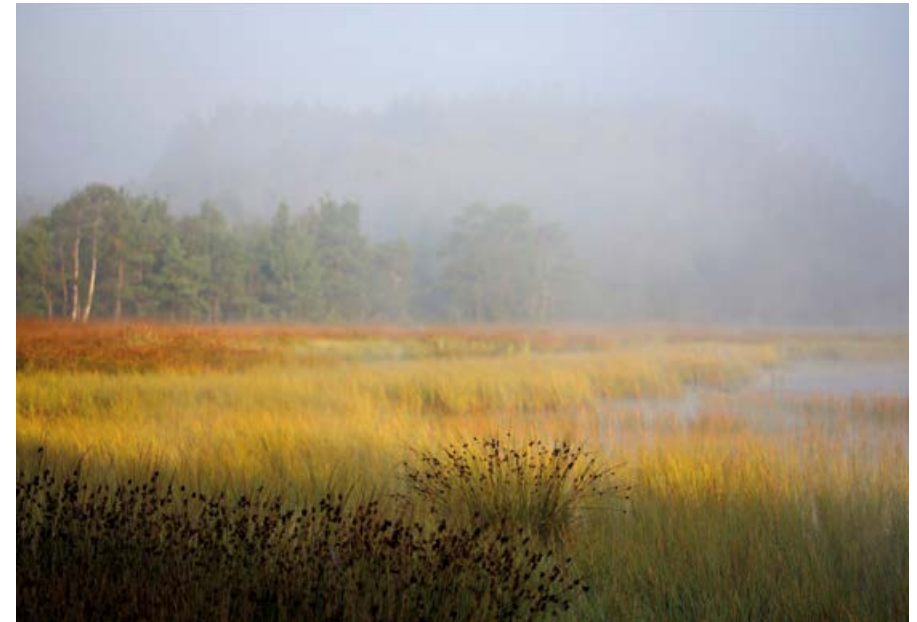
Torfowisko nad jeziorem Lipno.

Bagna od wieków były miejscami niedostępnymi, dzikimi i niebezpiecznymi. Od zawsze owiane aurą tajemnicy, którą tworzyły mroczne legendy i lokalne wierzenia, były to tereny nielubiane, o których znaczeniu wiedzano niewiele. Do niedawna miejsca te błędnie uważano za bezużyteczne lub mało wartościowe, przez co często je osuszano i przekształcano w tereny rolnicze. Wyraz mokradło pochodzi od słowa mokry, co wiąże się ze stałą obecnością wody. Można powiedzieć, że są to tereny przejściowe między ekosystemami wodnymi a lądowymi.